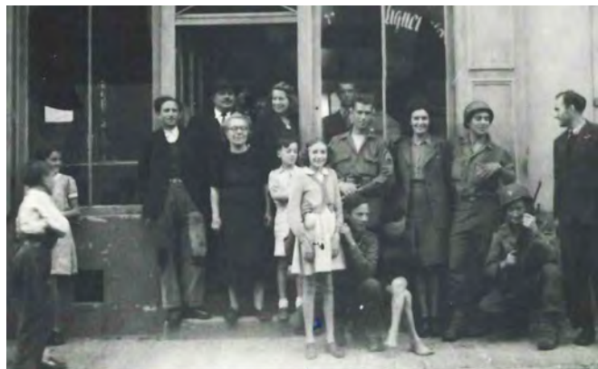
Des Triellois et quatre G.I. devant le Café du Centre, 117 rue Paul Doumer

Samedi matin, (le 26 août), des forces américaines sont signalées sur l'autre rive. Les troupes allemandes étant parties, la population croit à la libération et j'ai beaucoup de mal à maintenir le calme. Dans la nuit de samedi à dimanche, Triel subit un violent bombardement et le dimanche, de nouvelles forces allemandes (artillerie et éléments parachutistes) occupent à nouveau Triel. A 22 heures, nous recevons l'ordre d'évacuer la ville comme la totalité de la boucle pour le lendemain, lundi, 8 heures. Devant la résistance de la population, les allemands acceptent que les habitants se rendent dans les carrières. Dans la journée du lundi, nous subissons un nouveau bombardement. Le lieutenant de pompiers est tué, un gendarme et un civil sont blessés. Des salves d'artillerie se succèdent par dessus nous, de même la nuit suivante.