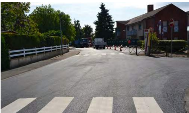
| Deux plateaux ont été créés devant l'école Jean de la Fontaine pour plus de sécurité.

La rue Paul Doumer, l'axe principal de la commune, a fait l'objet pendant l'été de travaux de modernisation par le Département des Yvelines. Les circuits d'arrivée d'eau potable ont d'abord été remplacés en juillet puis le tapis de chaussée ainsi que de la signalisation au sol ont été renouvelés début août. Par ailleurs, deux places sécurisées ont été créées.