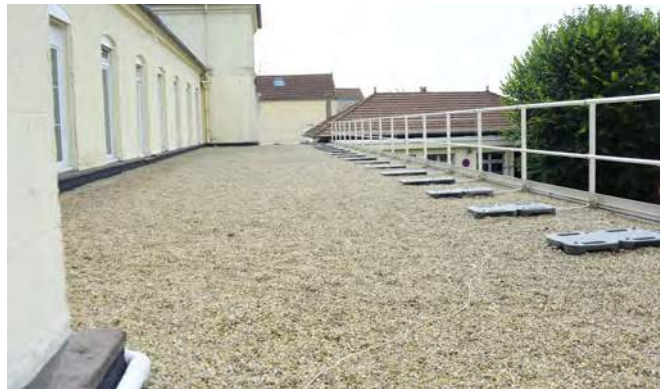
| La toiture-terrasse de la Maison des Associations a été entièrement refaite.