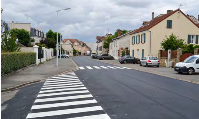
| Nouveau tapis de chaussée au centre-ville du 16 au 162 rue Paul Doumer