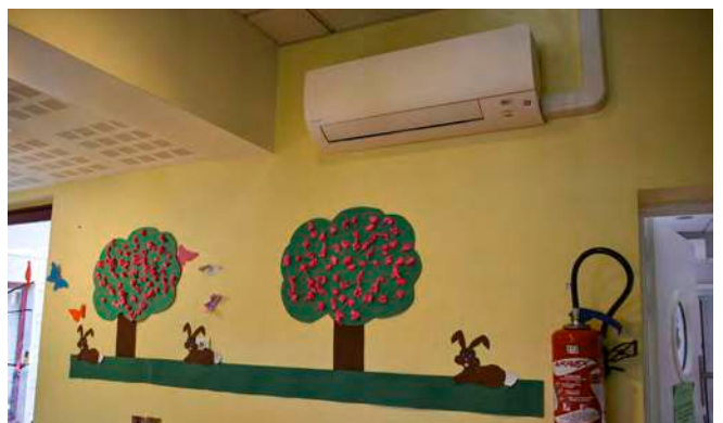
| La crèche bénéficie de deux climatiseurs depuis juillet.