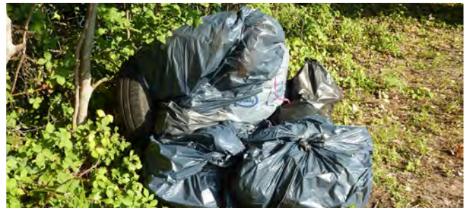
La police municipale intervient et enquête dès qu'un dépôt sauvage est signalé.

Mobilisée contre les dépôts sauvages de déchets, la Ville a recours systématiquement aux services de la police municipale pour diligenter les enquêtes nécessaires et verbaliser les contrevenants. Dans le même temps, les services de la Communauté Urbaine GPS&O sont sollicités pour l'enlèvement immédiat des dépôts sauvages.