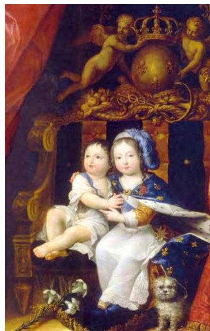
Le futur roi Louis XIV (à gauche) et son frère Philippe d'Orléans, en robe.