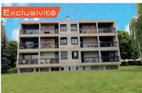
Exclusivité TRIEL SUR SEINE 35 000 € Adorable studette, lumineuse, état impeccable offrant entrée / pièce à vivre avec coin cuisine meublée Idéal INVESTISSEMENT ! Hono charge vendeur. DPE : G - 633.35. Copropriété de 100 lots (pas de procédure en cours) charges annuelles 480 €.