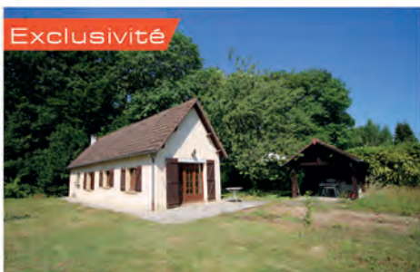
Exclusivité TRIEL SUR SEINE 245 000 € Lisière de forêt, plain pied offrant agréable pièce à vivre avec cuisine ouverte, accès jardin, chambre, sdb, buanderie avec accès aux combles aménageables pour chambres d'enfants. Terrain 550 m 2 . Hono charge vendeur. DPE : D - 230.