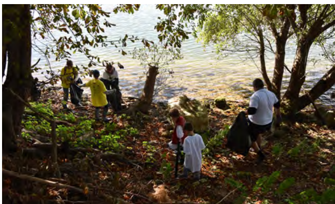
Les opérations de nettoyage citoyen des berges de Seine sont organisées trois à quatre fois par an

La Ville organise régulièrement des opérations de nettoyage citoyen des berges de Seine. Elle fournit les pinces, les gants, et les sacs poubelle. Des éco-citoyens volontaires arpentent ainsi les berges et y enlèvent les déchets.