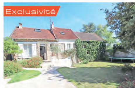
Exclusivité TRIEL SUR SEINE 400 000 € Maison édifée sur terrain de 387 m 2 offrant pièce à vivre avec cuisine ouverte accès terrasse, sde, 2 chbres, sdb. Rez de jardin : chbre accès jardinet, buanderie ; Deux caves voûtées ; appentis 2 voitures. Hono charge vendeur. DPE : E - 232.