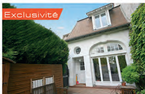
Exclusivité TRIEL SUR SEINE 313 000 € Maison bourgeoise offrant entrée, salon sur terrasse, cuisine sous verrière, deuxième salon ; suite parentale avec dressing, sde. A l'étage, palier, deux chbres, buanderie, sde. Place de parking extérieur. Hono charge vendeur. DPE : E - 299.