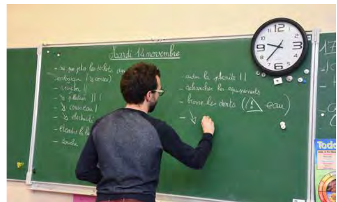
Les animateurs d'Énergies Solidaires dispensent des formations aux écogestes dans les écoles

Dans le cadre du partenariat avec l'association Énergies Solidaires, plusieurs actions sont menées. Parmi celles-ci, le personnel communal a bénéficié de formations aux écogestes dispensées par les conseillers info-énergie de l'association, de même que les élèves des écoles de la ville.