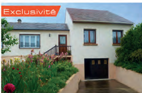
Exclusivité TRIEL SUR SEINE 334 000 € Plain pied surélevé offrant entrée, séjour lumineux, cuisine, deux chambres, salle de bains. Combles aménageables. S-sol total, garage trois voitures, pièce avec fenêtre, buanderie, atelier. Terrain de 459 m 2 . Hono charge vendeur. DPE : E - 252.