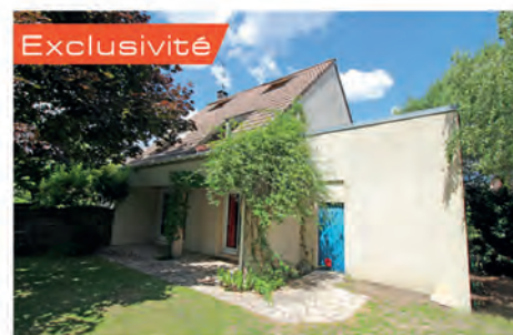
Exclusivité VERNEUIL S/SEINE 399 000 € Maison fonctionnelle comprenant salon/séjour avec cheminée donnant sur terrasse et jardin, cuisine. A l'étage palier, 3 chbres, sdb, comble aménagé en chbre. Garage avec mezzanine. Terrain 350m 2 . Hono charge vendeur. DPE : D - 188.