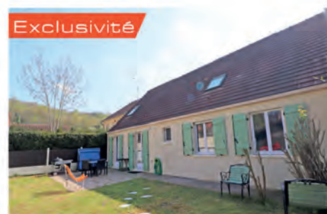
Exclusivité VAUX SUR SEINE 347 000 € Maison offrant au rez de chaussée agréable pièce à vivre avec cuisine ouverte donnant sur terrasse et jardin ; trois chambres, dressing, salle d'eau ; A l'étage, pièce de 37 m 2 , chambre avec salle de bains. Hono charge vendeur. DPE : D - 162.