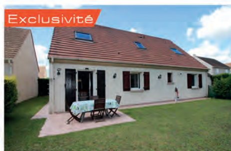
Exclusivité VERNEUIL S/SEINE 453 000 € Maison édifée sur terrain de 463 m 2 , composée d'un séjour traversant avec cheminée donnant sur terrasse, cuisine, cellier, chbre, sdb, à l'étage : 2 chbres dont une suite parentale avec sde. Garage. Hono charge vendeur. DPE : D - 185