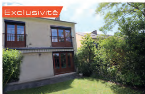
Exclusivité TRIEL SUR SEINE 354 000 € Maison familiale, lumineuse et spacieuse offrant entrée, séjour double avec cheminée, cuisine. A l'étage, palier, quatre chbres dont une avec sde, sdb. Au 2 ème cinquième chbre avec sde. Garage. Hono charge vendeur. DPE : D - 165.