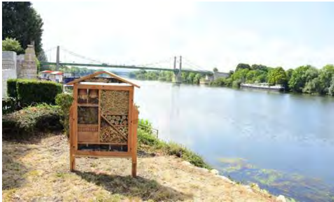
Des hôtels à insectes viennent d'être installés le long du Quai Auguste Roy, afin de favoriser la biodiversité.

lutter contre les chenilles processionnaires, et des hôtels à insectes ont été installés dans les parcs pour favoriser le développement de la biodiversité. Les plus récents ont été posés en juillet dernier le long du Quai Auguste Roy.