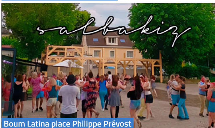
Boum Latina place Philippe Prévost