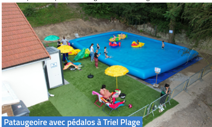
Pataugeoire avec pédalos à Triel Plage