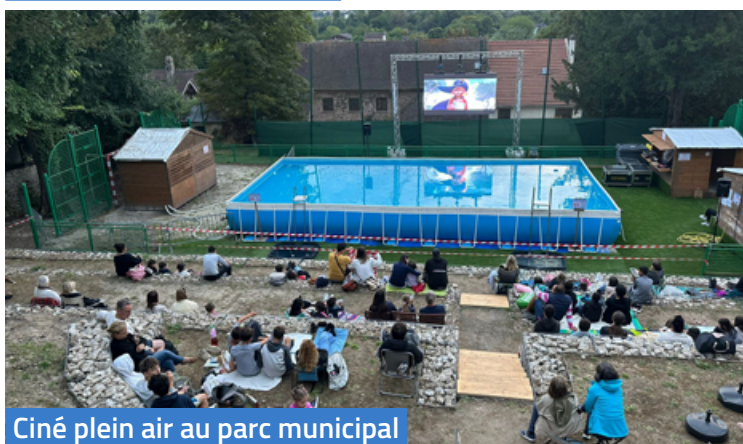
Ciné plein air au parc municipal