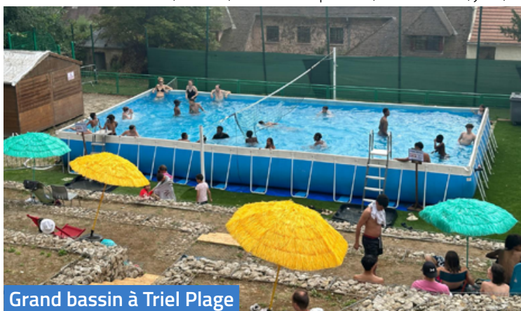
Grand bassin à Triel Plage

Comme chaque année dans le cadre des quartiers d'été, la Municipalité proposait de nombreuses activités variées et gratuites. Animations, sorties, cinémas en plein air, événements, jeux, soirées... Il y en avait pour tous les goûts et tous les âges !