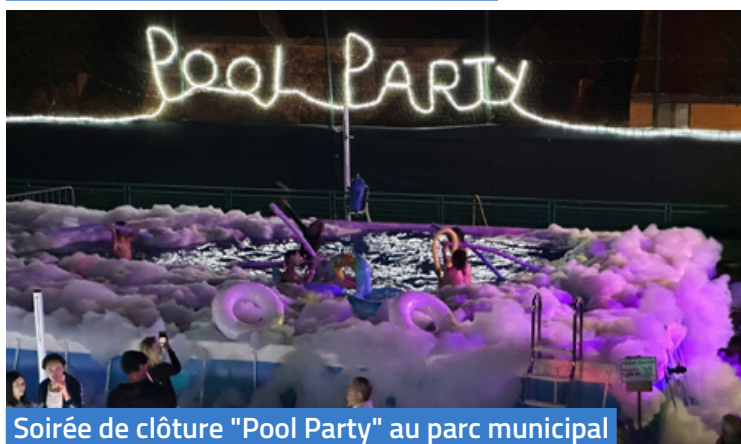
Soirée de clôture "Pool Party" au parc municipal