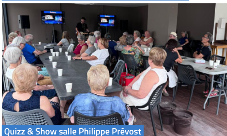
Quizz & Show salle Philippe Prévost